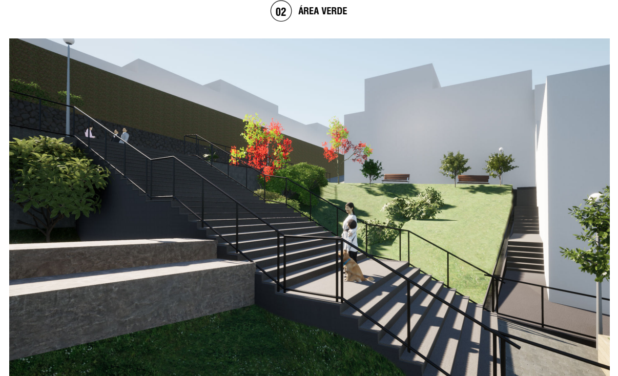
02 ÁREA VERDE