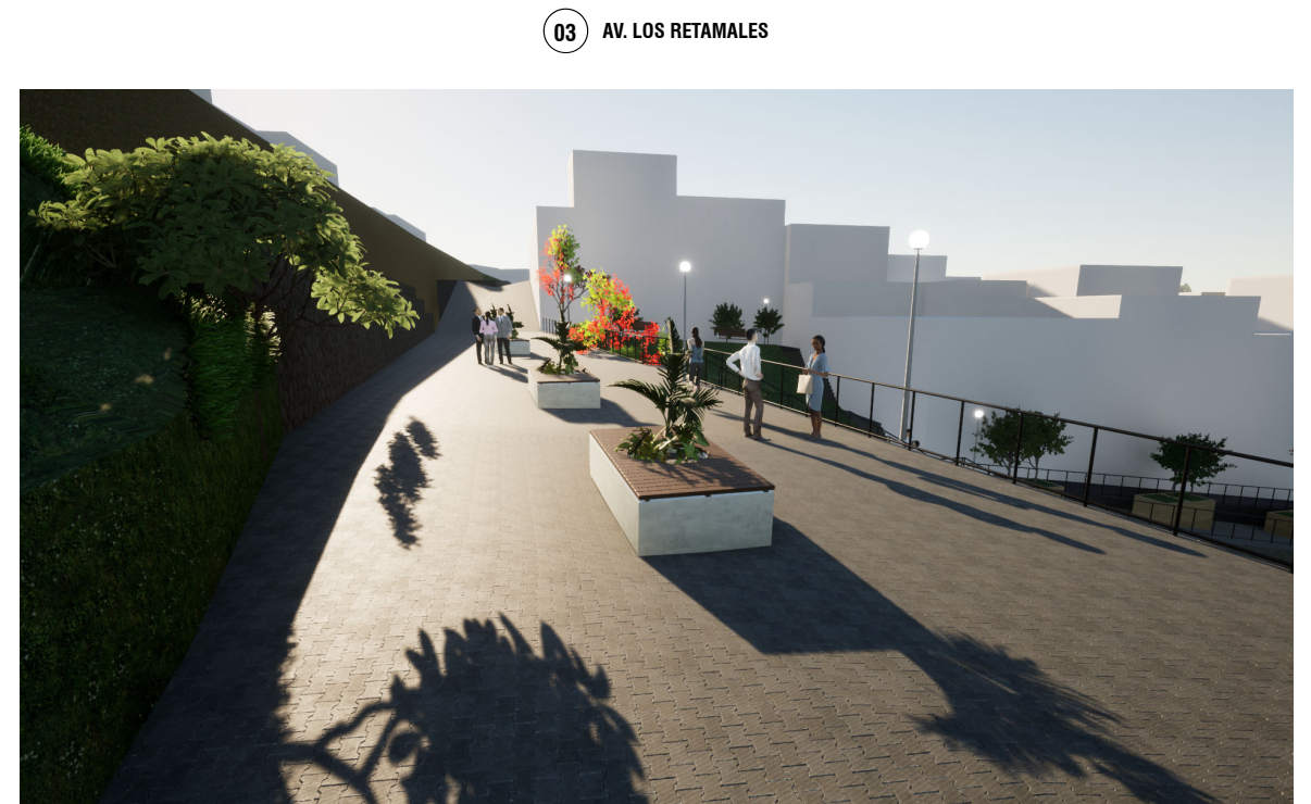
03 AV. LOS RETAMALES